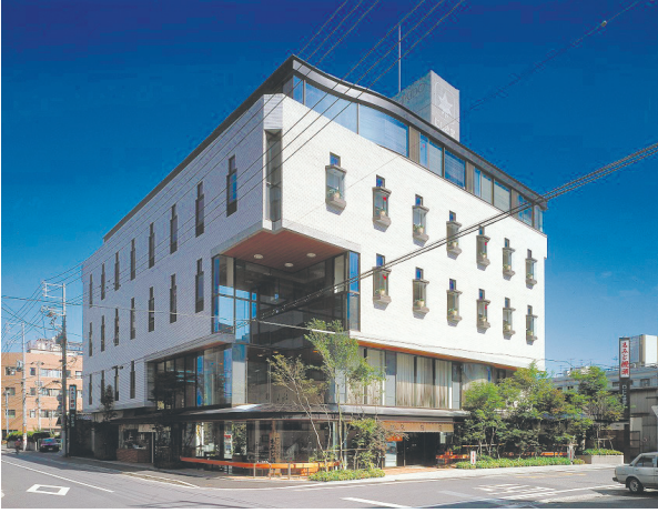
にしき堂本社ビル