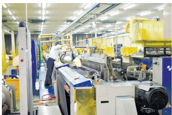
フル操業が続く篠原テキスタイルの工場。 社員は20人だ=10月19日、福山市駅家町