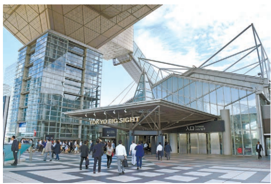
東京ビッグサイト