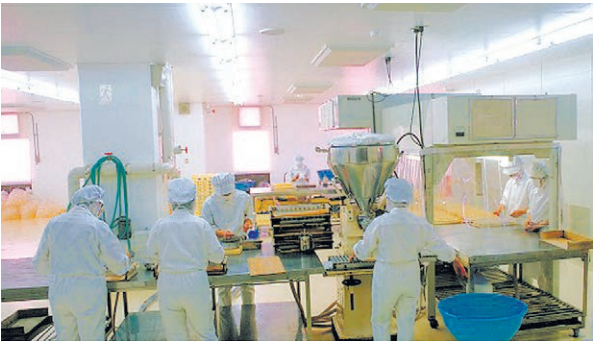
本社工場のクリーンルーム