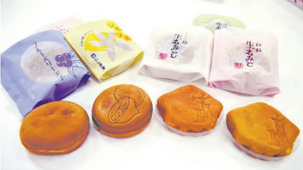
もちっとした食感が人気の「生もみじ」と、中に果物のジュレが入った「ロイヤルファミリー」