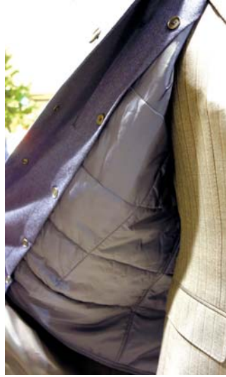
▲インナーはボタン式で取り外しができるため、晩秋から春先まで使える

今年の冬は、寒さが厳しくなると予想されています。「REDA アクティブ」を使用。ウール100%の上質な風合いでありながら、高い防水性と撥水性を誇ります。ビジネス&カジュアル対応なので、スーツの上に着ても、ニット&コットンパンツの上に羽織ってもOK。着回しができるのも、さまざまなシーンで活躍します。インナーの中綿ライナーは取り外し可能なので、少し温かくなってきた春先まで使うことができる、汎用性の高さも特徴です。