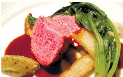
盛り付けも鮮やかな料理が楽しめる

外観から大人の雰囲気 気が漂うフレンチ料理の 「Maison de Chef」。開 業17年のお店です。落ち 着いた空間が広がる店 内は、オープンキッチン が印象的です。 心地良い緊張感とベ ストなタイミングで提 供される料理には、お 客さんを想う気持ちが 表現されています。ディ ナーコースは、4500 円〜10000円まで