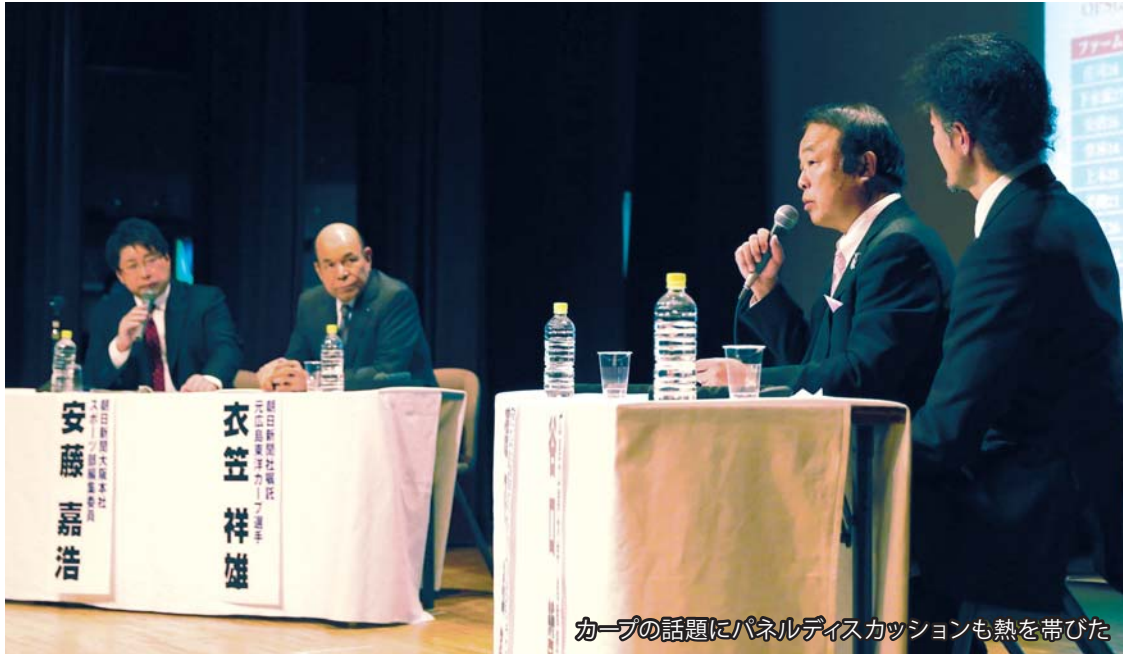
カープの話題にパネルディスカッションも熱を帯びた