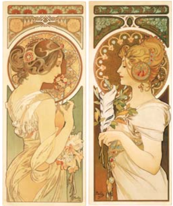
▲(左)《桜草》1899年 ▲(右)《羽根》1899年

アルフォンス・ミュシャ (1860-1939) は「アルヌーヴォー」の代表的な画家として広く知られ、19世紀末から20世紀初頭にかけフランス・パリや祖国チェコを中心に活躍しました。当初は歴史画家を目指していましたが、パリの舞台女優サラ・ベルナルの演劇ポスターを制作したことをきっかけに、グラフィックデザインの世界で一躍人気作家となります。植物をモチーフにした華麗な装飾や、流れるような曲線で描く優美な女性像で独自の画風を確立したミュシャは、あらゆるジャンルでデザインの才能を開花させました。本展では、ポスターや装