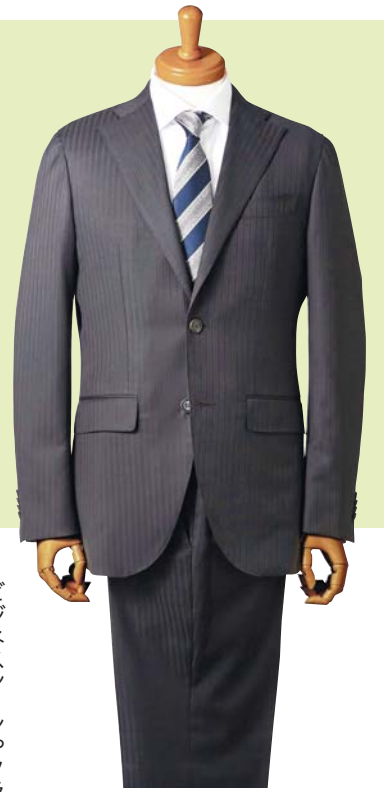
▲ナポリクラシコモデル サイズ: 40~55 価格: 82,080円

着心地が良くフィット感のあるスーツを着用すると、いつもよりビジネスがスムーズに運ぶような気がしませんか? シンプルかつこだわりの強いメンズスーツは、独自のスタイルを好むビジネスパーソンに選ばれています。 価格: イセタンメンズスーツ 71,280円~