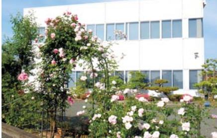
染色で出る汚泥と社員宅の生ゴミを処理した肥料で育ったバラに囲まれた本社社屋