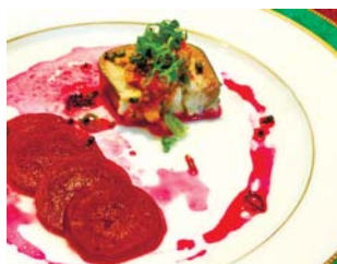
サンマのテリーヌとビーツの甘酢漬け

広く明るい内装にこだわった店内の「中国料理 蓮華」。ゆっくりとくつろげる空間で食事が楽しめます。調理も接客もこなすオーナーが、真心こめて対応します。無農薬野菜などの健全な環境下で育まれた食材を使用し、お客さんをもてなします。メニューは季節によって異なり、いまは