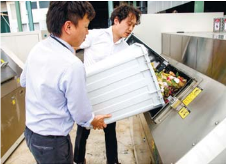
社員宅の生ゴミも社備え付けの処理機で肥料にする。この処理機も環境事業部の営業品目。においがしないという

最新設備と複数の医療スタッフで、年間約200件の手術実績。 (H25年1月～H25年12月)