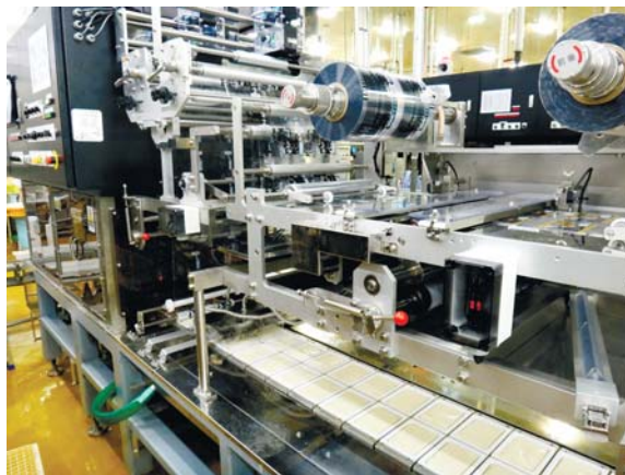
最新のラインでは、人に触れられることなく豆腐(下)が作られていく