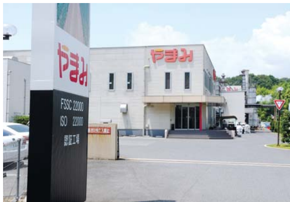
現在の本社工場に移転し、機械化に力を入れるようになった=三原市