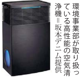
環境事業部が取り扱っている高性能の空気清浄機