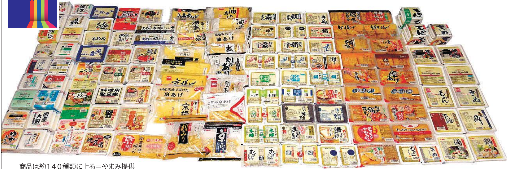
商品は約140種類に上る