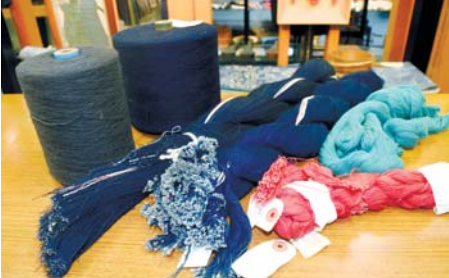
坂本デニムの製品見本。中央のインディゴ染めの糸は「芯白」がよく分かる