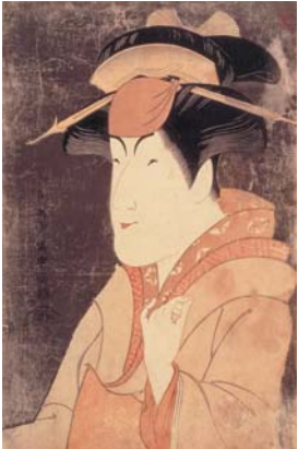
東洲斎写楽「中山富三郎の宮城野」

尾道市立美術館 http://www7.city.onomichi.hiroshima.jp/