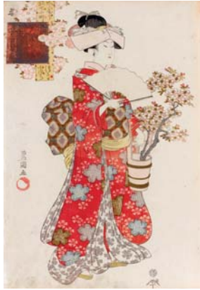
歌川豊国「やう娘七町・清水小まつ」

歌舞伎が老若男女にとって最大の娯楽だった江戸時代。中でも寛政6年(1794)頃は、新進気鋭の絵師・歌川豊国(1769-1825)をはじめ、彗星のごとく現れた東洲斎写楽(生没年不詳)が活躍し、その時期、衰退気味だった役者絵の刊行量はこの2人に牽引されるように増加します。本展では、写楽と豊国を軸にした寛政期の浮世絵を出発点として、幕末に至る歌川派の役者絵と美人画の流れを、約140点の作品で紹介いたします。