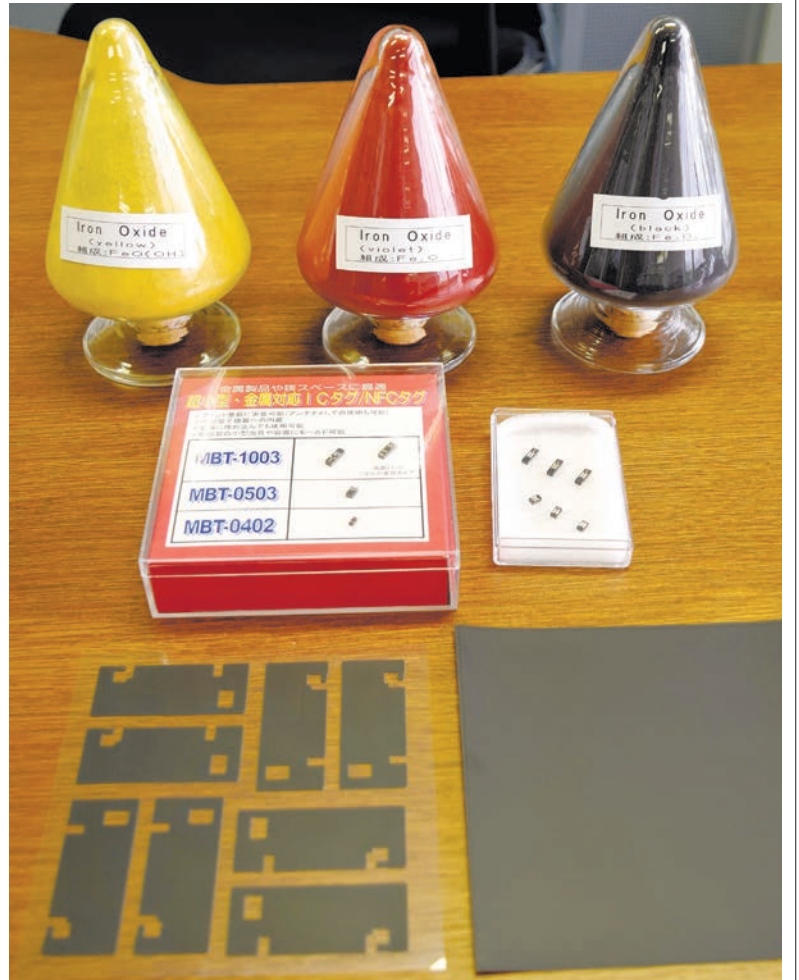
幅広い用途を持つ戸田工業の製品。(上から) いろいろな機能を持つ様々な酸化鉄、ICタグ、スマホなどに使われるフェライトシート=広島市南区

——6月に社長に就任しました。抱負は、 オーナー家の社長の トップダウンで長くやっ てきた会社ですが、私に とっては新入社員で入っ て30年以上いる会社。同 じようなことはできませ ん。トップに言われた人 が個々に動くのではなく、 組織として機能できるよ うに旗振りができたらいい。 みんなが会社を意識 して考えて、動くことが 必要だと思っています。 ——酸化鉄は、ベンガ ラからは想像できない使 われ方をしています。 やはりすべてには社会 のニーズがあった。一番最 初は、良い赤を着色する