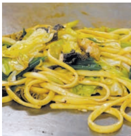
和牛ホルモン焼きうどん

今年の5月にオープンした「一カ」。5人の子どもを持つ気さくな「お母さん」がお店を一人で切り盛りしています。もともと兵庫県佐用町で初めてホルモン焼きうどんを始めた老舗で、このお店で三代目です。ずっと愛されてきた味を途切らせたくないという思いで、広島にお店を開きました。 このお店のホルモン焼きうどんには、3つのこだわりがあります。和牛ホルモン、佐用町直送の