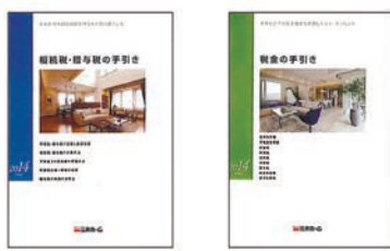
相続税・贈与税の手引き 税金の手引き

平成27年1月1日からの税制改正は、相続基礎控除額が引き下げになっており、所有不動産の地域によっては、相続税の課税対象になる人が大幅に増えると言われている。三井ホーム中国支店(広島市中区中町)では、相続や贈与、資産運用などについて専門家が開設するセミナーを、10月19日(日)13時より同社セミナールームで開催する。参加費無料。事前予約制。