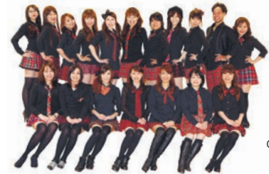
Present BA CD「悪女ネレーション」 2名様

広島県の活性化活動などを行う悪女時代が、広島城おもてなし隊・恋水姫(こいみずぎ)として、広島城内堀を活用した遊覧船・権伝馬(かいでんま)でPR活動を行う。乗船した人へ城のいろいろなスポットやいわれなどを楽しく紹介するボランティア事業で、10月25・26日と11月の毎週日曜日に運行する。乗船は有料、1日6便の運行を予定。この機会に、広島城へ足を運んでみては。恋水姫のメンバーも募集中、詳しくはfacebookで。