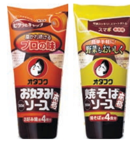
お好みソース200g 焼そばソース200g セットで12名様

オタフソースは、「お好みソース」「焼そばソース」などの商品で、容器とキャップをリニューアルした。新容器「スマボ(スマートフボトル)」は、握りやすい適度な厚みは保ちつつも、より冷蔵庫内で収納しやすいよう容器の幅がスマートに。新キャップ「ピタッとキャップ」は、吐出部にスリット弁(十字に切り込みを入れたシリコン)を設置したことで液切れが良く、キャップの汚れを軽減できるようになった。