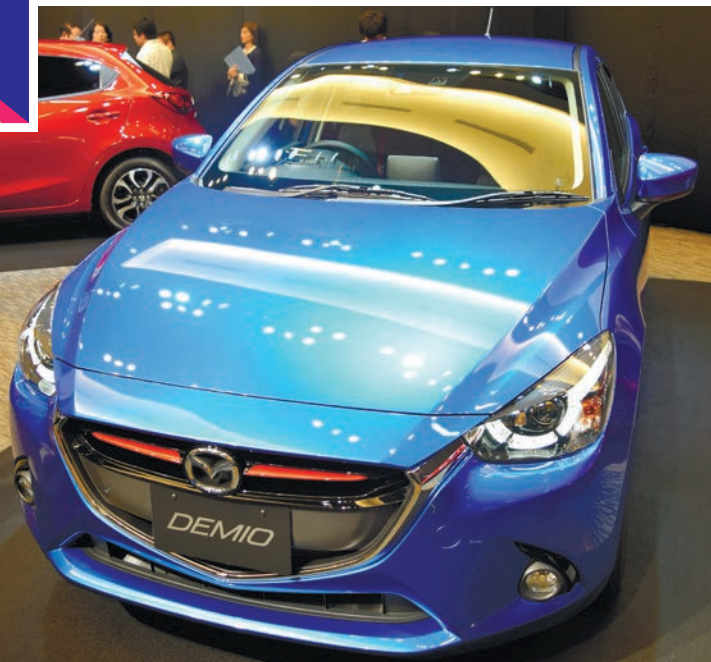
車体前方の赤いラインがディーゼル車の印 =9月、東京都港区