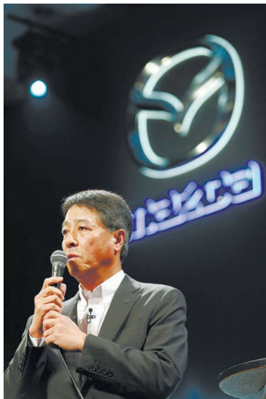
マツダの小飼雅道社長はデミオへの期待を語った =9月、東京都港区