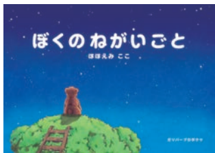
Present BA ぼくのねがいごと 5名様

穴吹デザイン専門学校の卒業生、ほほえみこさんの著作「ぼくのねがいごと」がガリバープロダクツから発売される。アニメーションのプロデュースなどに携わってきた著者の初となる絵本で、くまの男の子「ぼく」の運命的な出会いと、切ない初恋の物語。色鮮やかな色彩とやさしいタッチの絵で描かれている。デザイン専門学校卒業生ならではのこだわりが詰まった1冊。全国の書店で、10月24日より発売。1,500円(税別)。