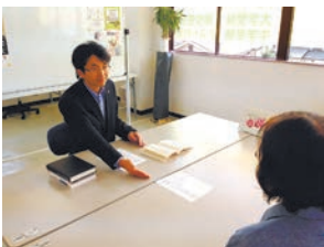
(11月末までに入塾された方) 入塾金免除& 数・英教材を無料に ※公務員試験・宅健・行政書士試験・FP試験対策への入塾金も免除します

進学スクールヒロシマ塾(広島市安佐南区上安)では、今月から来年3月までの毎週土曜日に高校入試対策の講座(集団授業)を開催する。安佐南区の被災した生徒は、3月までの授業料が全額無料(先着5名まで)。また、11月末までに入塾する中学生の生徒は被災した方に限らず、入塾金3万円免除および数学・英語の教材を無料で提供する。授業料は月9,000円。担当者は「少しでも被災された方の力になれば」と話している。