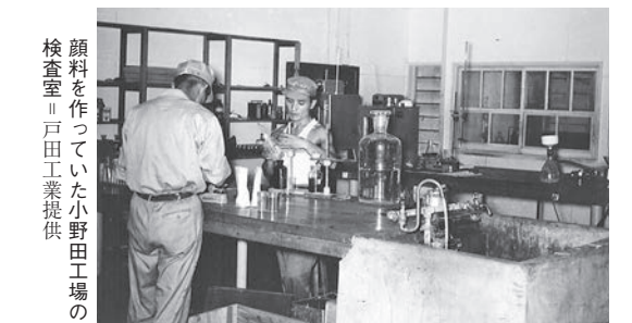
顔料を作っていた小野田工場の 検査室

「ビジョナリーカンパ ニー」は出たところに読み ました。大きな車輪を一 生懸命押していくうちに だんだん回り出して、そ のうち止まらなくなると か、研究と似ているなど やめたら、本当に止まっ てしまいますから。 最初から結果が保証さ れた仕事はなくて、やり 遂げれば何らかの形にな る。いまやっていること は10年後の会社のためと 思っています。もっと早 く会社のためになればいい のですが、手っ取り早 くもうかるような仕事は なかなかありません。