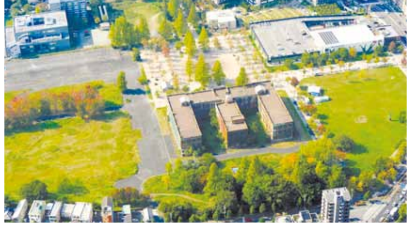
広島大学本部の跡地。中央が旧理学部1号館で、左と下が民間事業者が開発する予定の敷地=広島市中区東千田町