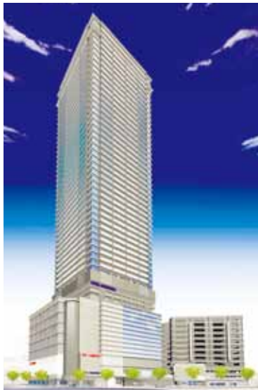
広島駅南口Bブロックに建設される再開発ビルの完成予想図

広島駅南口では、西からA、B、Cブロックに分かれて再開発が計画されてきた。Aは百貨店の福屋を核にした「エールエールA館」として1999年4月に開業。Bはビックカメラを核に今年4月に着工して完成は2016