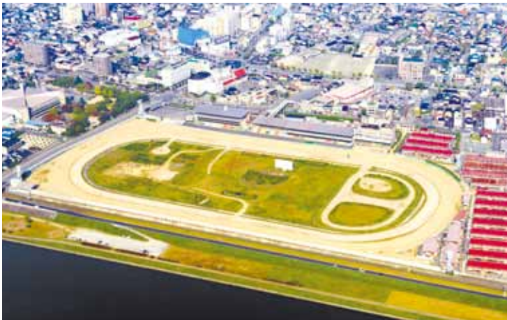
福山市営競馬場跡地=福山市千代田町1丁目