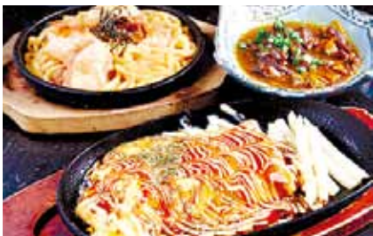
おすすめのオリジナルメニュー

福山市にある居酒屋「一鉄」は昨年、15年目を迎え、久松通りから延広町の国道沿いに移転オープンしました。ガツンとおなかにたまる鉄板肉料理など、舌になじむ居酒屋メニューが、楽しいひとときを盛り上げてくれます。ガーリックバターを絡めながら食べるハラミステーキは、極上のハラミとまろやかなバターがマッチし、食べたらかみつきになること間違いなしです。ほかにもホルモン焼きうどん、オムチーズ、