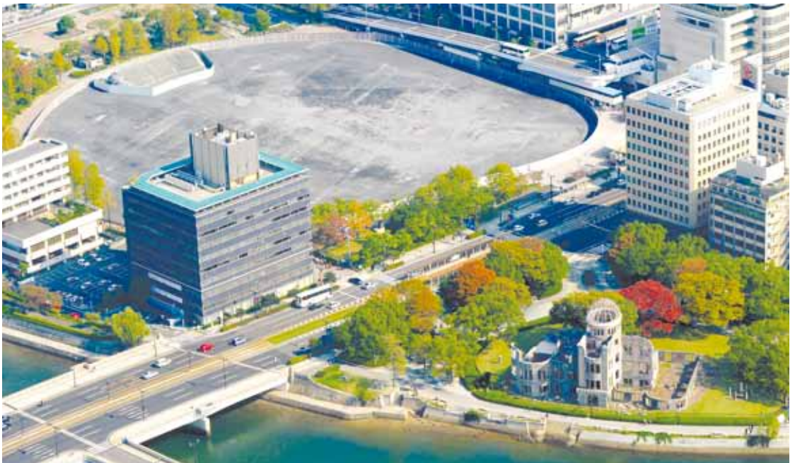
隣接している、原爆ドーム(右手前)、旧広島市民球場跡地(奥)、広島商工会議所ビル(左手前の黒い建物)＝広島市中区、本社ヘリから、筋野健太撮影

県や広島市などが6月に発足させたサッカー場建設の検討協議会は、来年3月に中間報告、来年度に最終報告を出す方針。球場跡地を候補に推すような結論になれば、市は再び判断を迫られることになる。広島市内に数多く残る「跡地」の再開発は、以前にも大きく前進した時期があった。だが、リーマン・ショックが起きた2008年前後の世界的