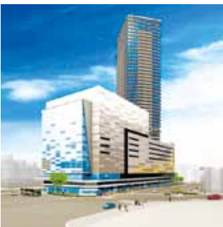
広島駅南口Cブロックに計画されている再開発ビルの完成予想図

Bは0.8畝の敷地に高さ約200m、52階建ての西棟と、10階建ての東棟を建てる。西棟は家電量販店のビックカメラを核にホテルやオフィスが入り、