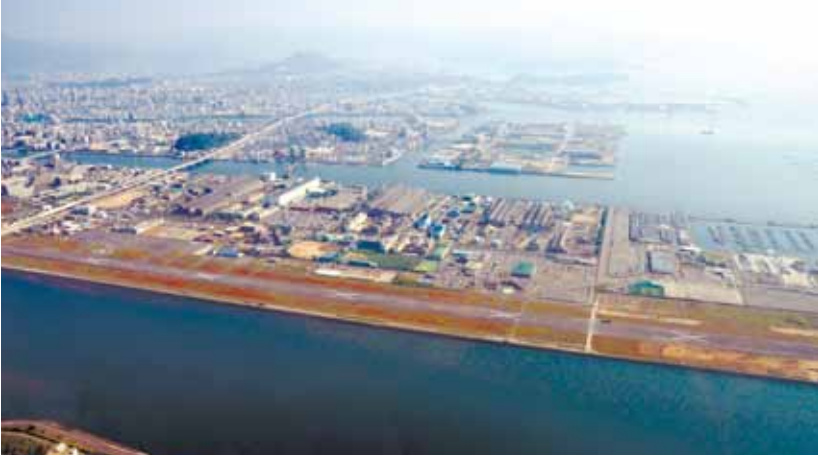
滑走路などが残る広島西飛行場の跡地。マリーナホップに隣接する南側(右手)で観光、商業施設の誘致などが検討されている=広島市西区観音新町4丁目