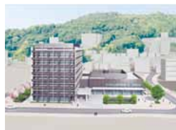
県などがつくる医療拠点の完成予想図

新しい街は西から東に1〜5の区画に分かれる。1街区は、中区の広島東警察署が移転するほか、日本アイコムが住居施設を計画。2街区ではスーパのイズミが駅の南側にあった本社を移転して11月にすでに開業。隣には家具量販大手のIKEA Aが出店する。3街区は、県のがん治