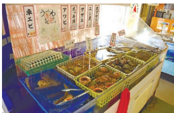
サザエやエビ、肉、野菜なども