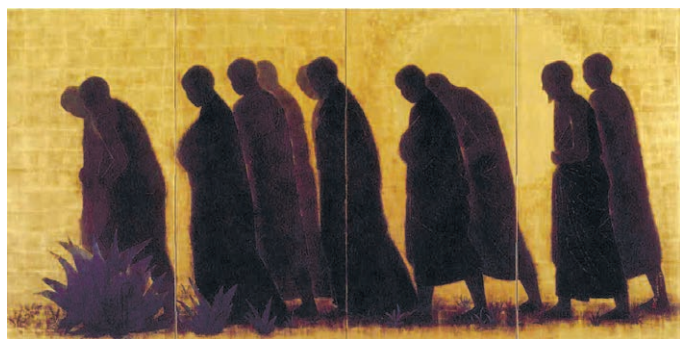
《教法高僧東帰図》1964年

後援/広島県、広島県教育委員会、公益社団法人ひろしま文化振興財団、尾道市、尾道市教育委員会