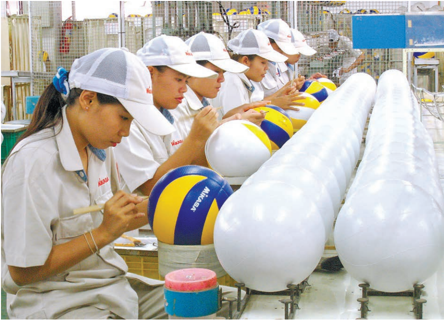
ボールを製造するタイ工場の従業員。