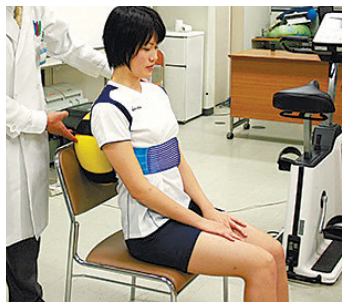
ミカサは健康グッズも開発。背筋力を鍛える製品を試着する女性。

品を開発し続けてきた。その人間関係が大きい。自社工場を持つているので、選手の意見を聞き、大学研究室などの協力も得ながら、試作を繰り返すことができます。