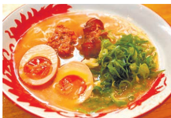
ボリューム満点の そーきとんこつラーメン

あつさり風味のしよ うゆ豚骨スープに細麵。 真ん中には軟骨までト ロトロになるほど煮込 んだ豚のあばら肉(そー き)が存在感を示して います。様々な豚の旨 みが凝縮されて絡み合 う味のハーモニーは、 多くのラーメン好きを 魅了してやみません。 そーきとんこつラー メンは650円で、そー き増量で煮玉子も乗っ