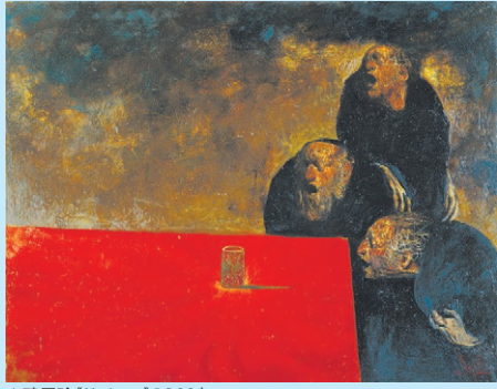
▲鴨居玲(サイコロ)1969年

招待券 ペア5名様 入場券をプレゼントします。 応募方法は4ページをご覧ください。