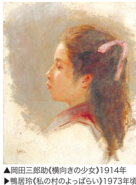
▲岡田三郎助(横向きの少女)1914年 ▲鴨居玲(私の村のよばらい)1973年頃

ウッドワン美術館は廿日市市吉和に位置し、近代日本絵画、マイセン磁器、アール・ヌーヴォーのガラス作品、中国清代の陶磁器、幕末・明治の薩摩焼など様々なジャンルの作品を所蔵しています。はつかいちギャラリーでは毎年テーマを決め、ウッドワン美術館の収蔵品をご紹介します。