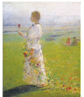
アンリ・マルタン「野原を行く少女」1889年 個人蔵

ひろしま美術館では、1月30日(土)~3月27日(日)まで、「最後の印象派 1900-20's Paris」展を開催する。アンティミスト(親密派)と呼ばれる画家たちが中心となって立ち上げた「画家彫刻家新協会(ソシエテ・ヌーヴェル)」に焦点を当てた展覧会は日本初。印象派を思わせる自然と向き合った穏やかさと、詩情豊かな画風が楽しめる。油彩画約60点、水彩・版画など約20点を展示。入館料は一般1300円、シニア(65歳以上)1100円、高大生1000円、小中学生600円。会期中無休。