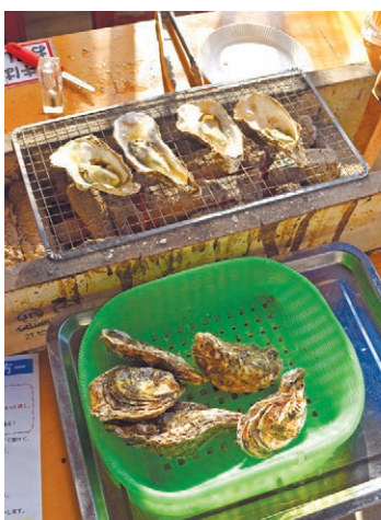
ぐつぐつと焼けて辺りにカキの香りが漂う

オイスターロードの各店舗は冬から春のみの営業で期間は各店で異なる。詳しくはひろしまオイスターロード協議会のホームページ（ http://oystersroad.jp ）。（木村和規）