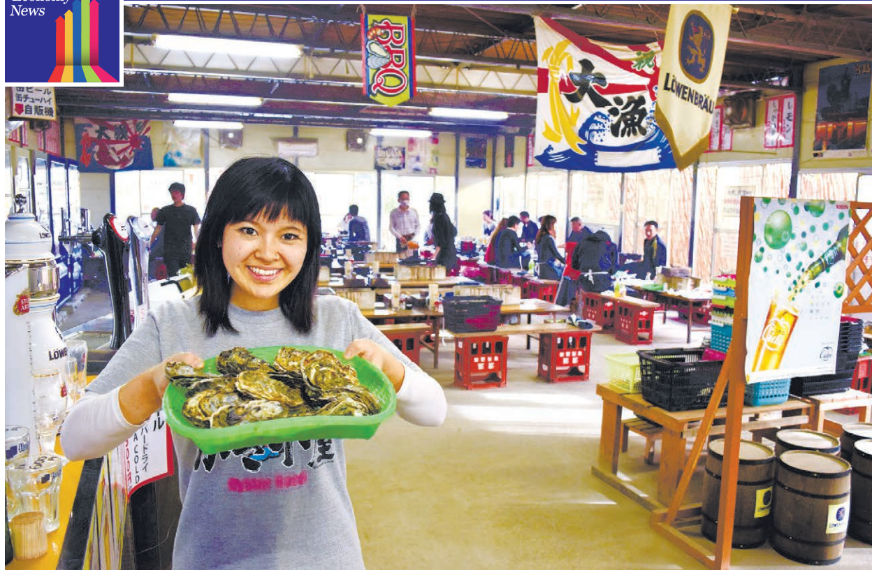
ひろしまオイスターロードの店舗